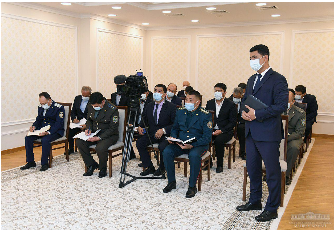
Yig'ilishdan so'ng Prezident Shavkat Mirziyoyev Toshkentga jo'nab ketdi.