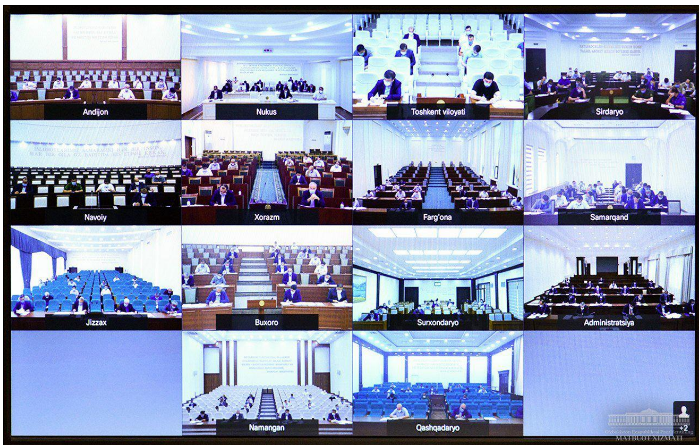
Yig'ilishda Davlat o'rmon xo'jaligi qo'mitasi va hududlar rahbarlari axborot berdi.

O'zbekiston Respublikasi Prezidentining MATBUOT XIZMATI