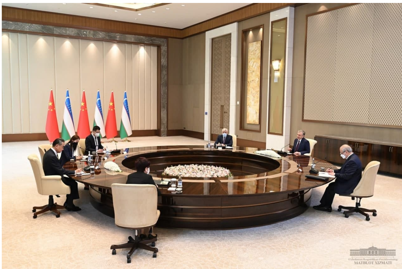
O'zbekiston Respublikasi Prezidenti Shavkat Mirziyoyev 15-iyul kuni mamlakatimizda rasmiy tashrif bilan bo'lib turgan Xitoy Xalq Respublikasi Davlat kengashi a'zosi, tashqi ishlar vaziri Van Ini qabul qildi.