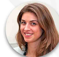
Ла Тойя Ваха

23 февраля состоялась научно-практическая конференция на тему: «Опыт стран Центральной Азии и ЕС в сфере реабилитации и реинтеграции репатриантов».