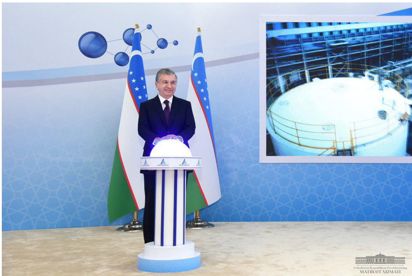
На церемонии выступили ветераны труда и молодежь, инженеры из Китая.