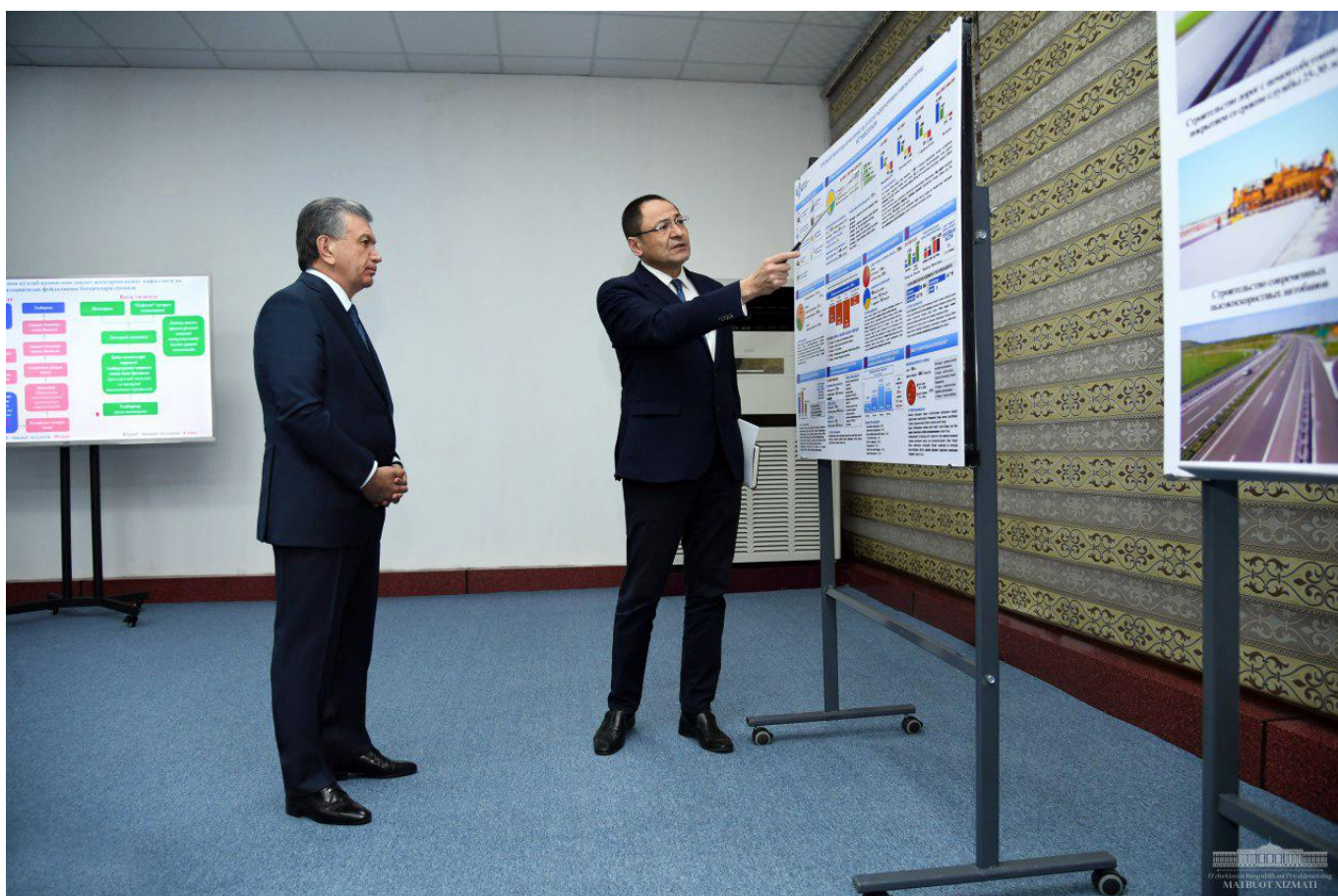
- У Сурхандарьинской области огромные экономические возможности. Здесь много подземных богатств, имеются почти все элементы таблицы Менделеева. Мы должны эффективно