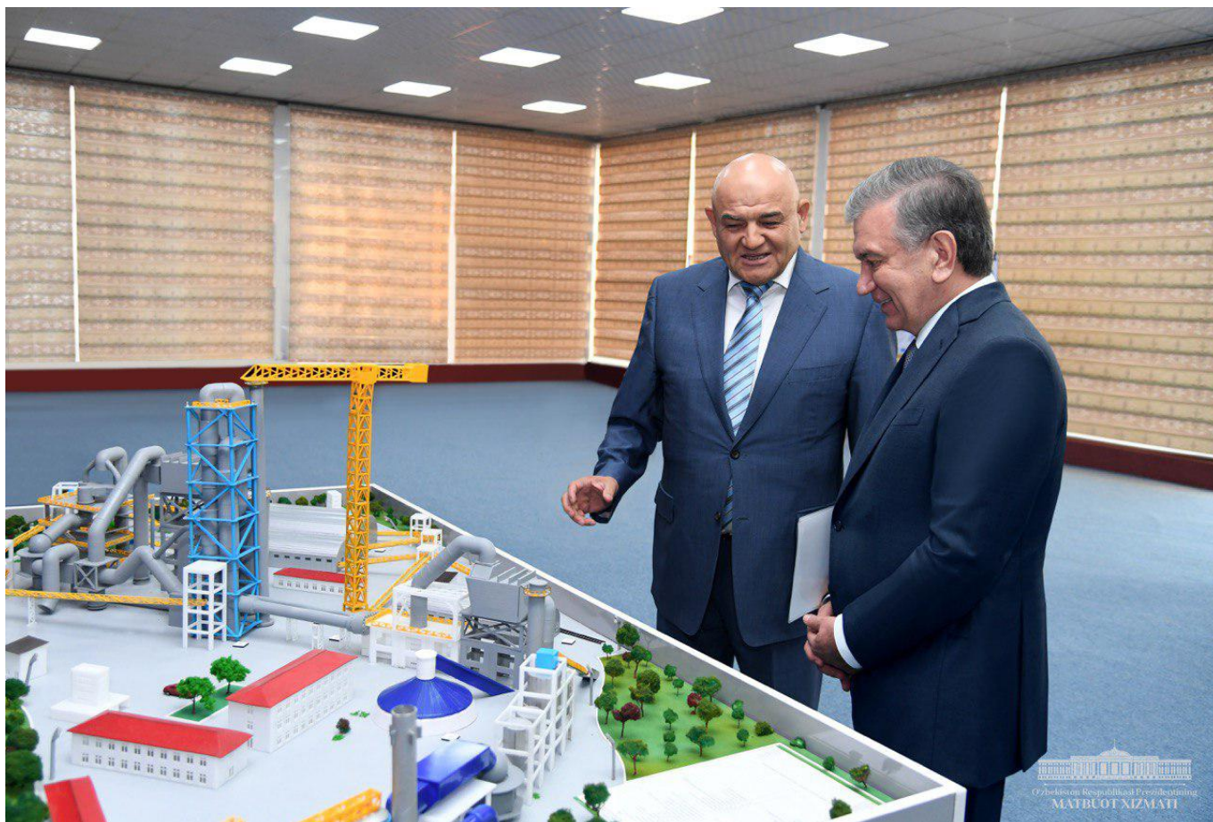
Президент Шавкат Мирзиёев ознакомился с деятельностью предприятия.