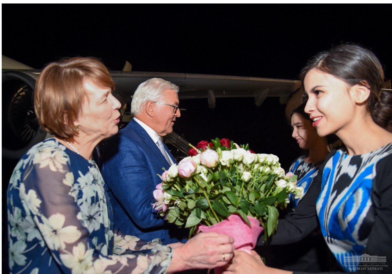
Тошкент халқаро аэропортида олий мартабали меҳмонни Ўзбекистон Республикаси Бош вазири Абдулла Арипов кутиб олди.