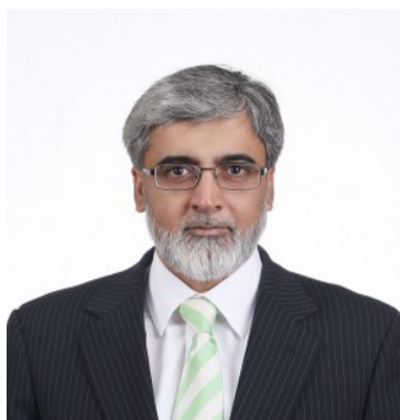
Покистоннинг Афғонистондаги Фавқулудда ва мухтор элчиси

Ўз навбатида, Марказий Осиё мамлакатлари ва Покистон ўртасидаги салоҳият ва ҳамкорликни ривожлантириш имкониятларини тадқиқ этиш мақсадида жорий йил июнь ойида Панжоб университетида Минтақавий интеграция маркази очилди.