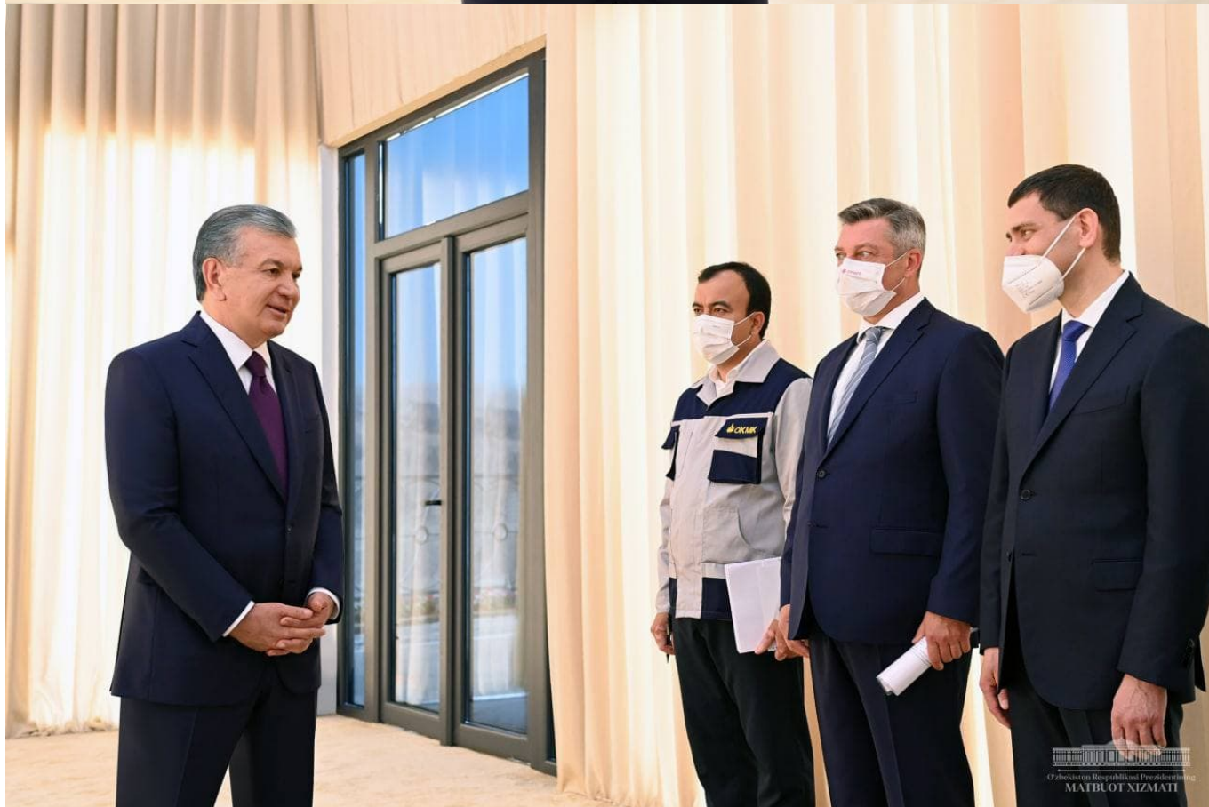
Президент Шавкат Мирзиёев 29 июль куни Олмалиқ кон-металлургия комбинатининг “Ёшлик-1”