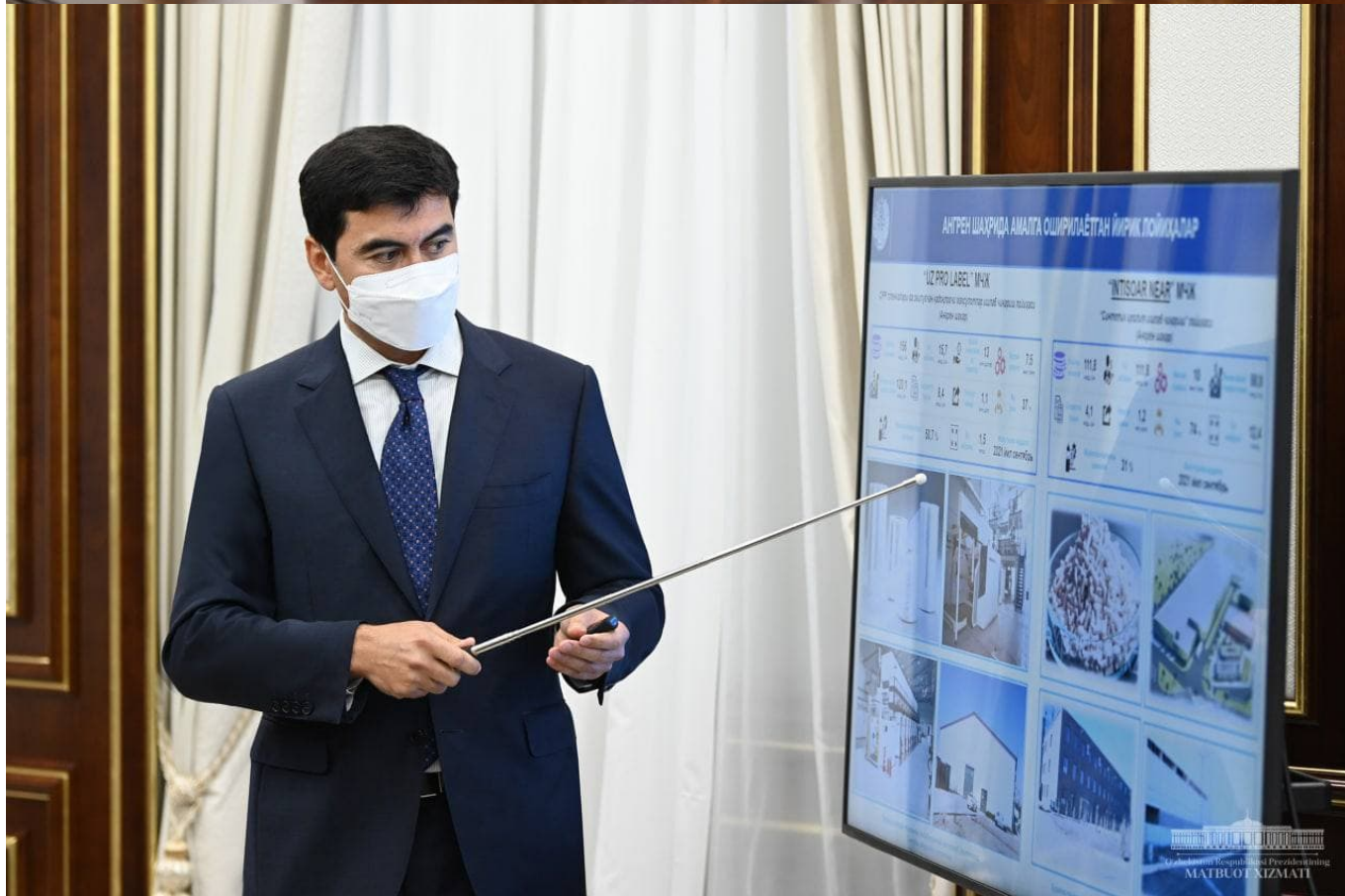
Президент Шавкат Мирзиёев 10 август куни Тошкент вилоятида саноатни ривожлантириш